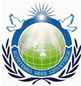
Horváth Ferenc békenagykövet