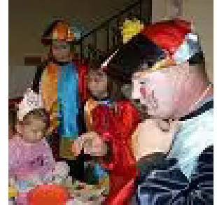
arcfestés és lufizás