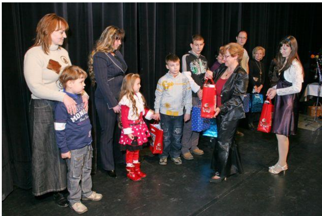
Deti obdarované na benefičnom vianočnom koncerte

Hodnota vecných a finančných darov , ktoré fond poskytol chorým deťom a nemocnici v období od 12. 2. 2001 do 31. 12. 2010 číni 212.285 EUR (6.395.298 Sk).