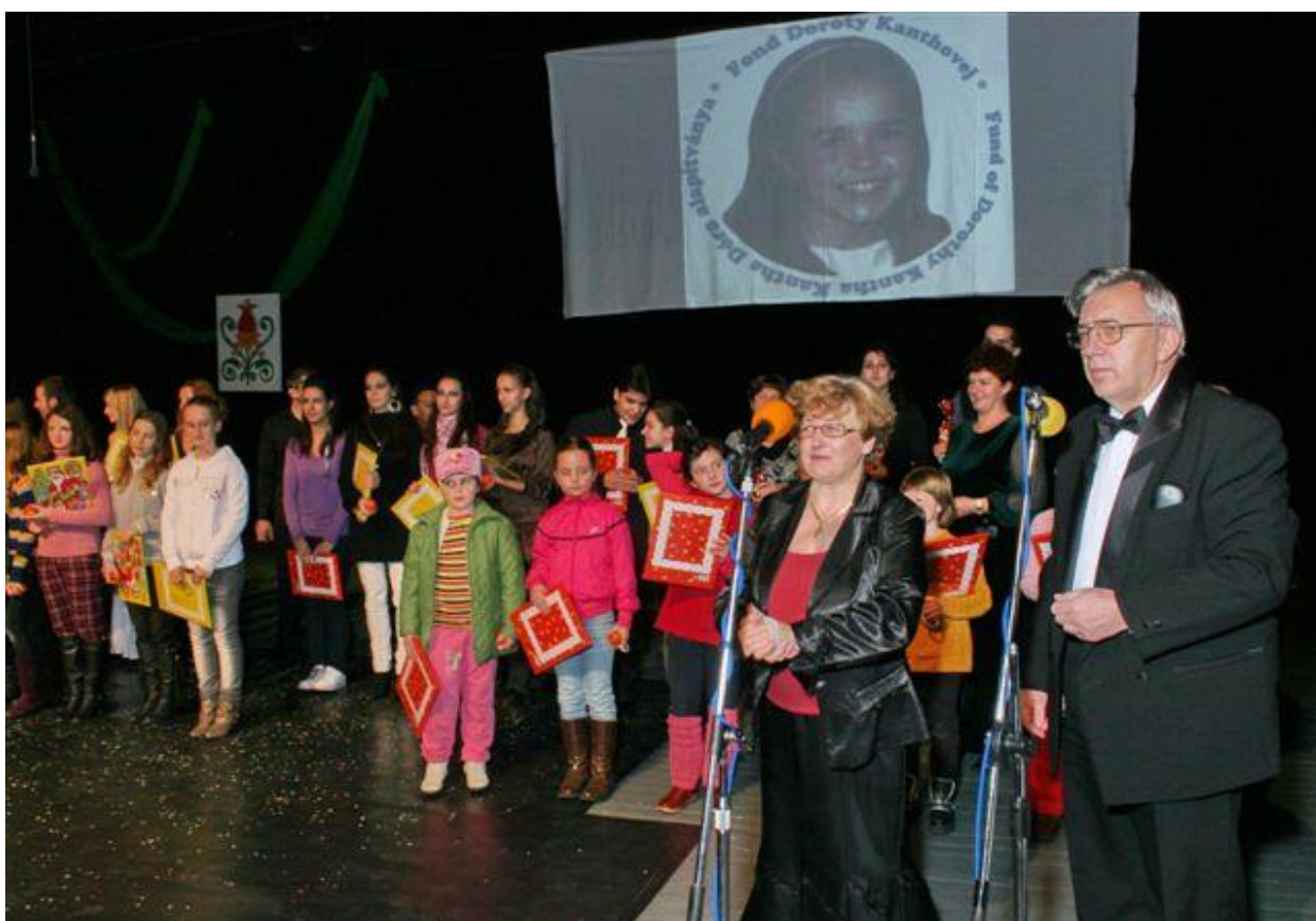
Organizátori a žiaci ZUŠ Komárno