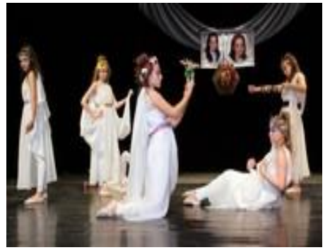
Vystúpenie žiakov Súkromnej základnej umeleckej školy Sylvie Czafrangóovej