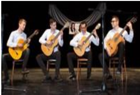
Gitarové kvarteto pedagógov ZUŠ Komárno