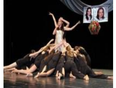
Tanečná skupina ZUŠ Komárno