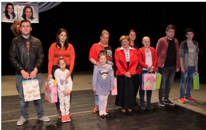
Deti, ktoré prevzali peňažné a vecné dary