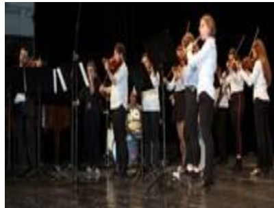
Súbor ZUŠ Komárno